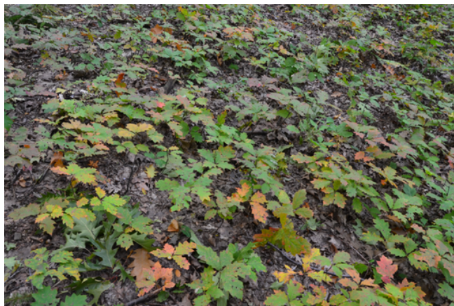
Drzewostany zdominowane przez dąb czerwony