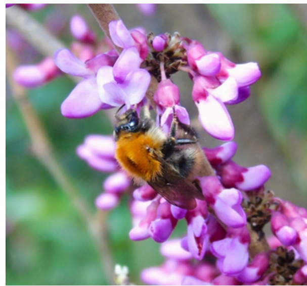
Trzmiel rudy Bombus pascuorum (Scopoli, 1763)