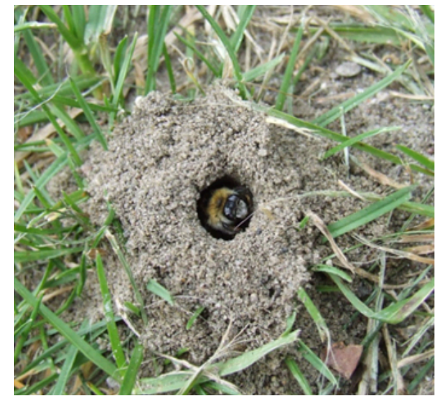
Przedstawiciel rodzaju Andrena (pszczolinka), gniazdujący w glebie