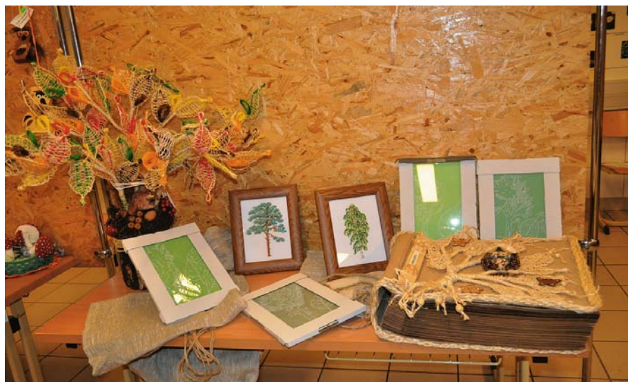
Fot. 2. Pierwsze miejsce w kategorii „Las w sztuce” Photo 2. First place in category: Forest in the Arts