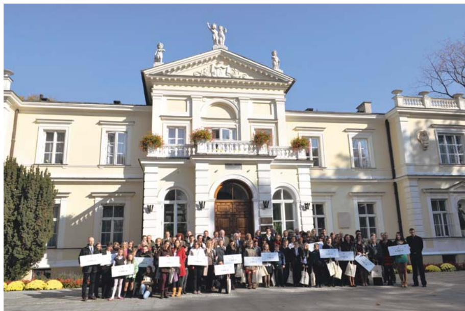
Fot. 3. Finałiści VII Edycji Konkursu „Czysty Las” przy Rektoracie SGGW w Warszawie Photo 3. Finalists of 7th Edition of the “Clean Forest” Contest at the WULS