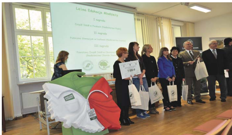
Fot. 1. Pierwsze miejsce w kategorii „Leśna Edukacja Młodzieży” Photo 1. First place in category: Children Forest Education