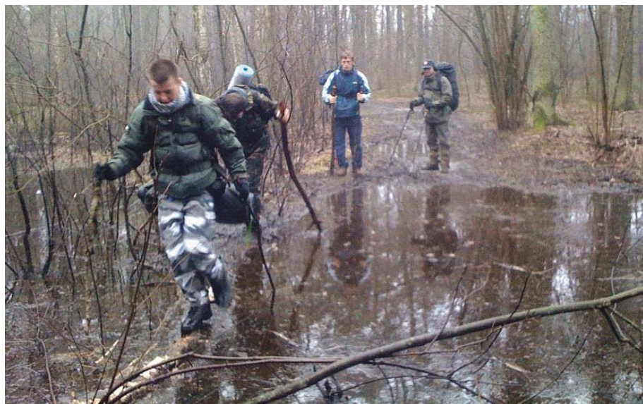
Fot. 2. Pokonywanie przeszkód terenowych na szlaku

Photo 1. Proposed route Dziekanów Leśny-Rozłoka-Leszno