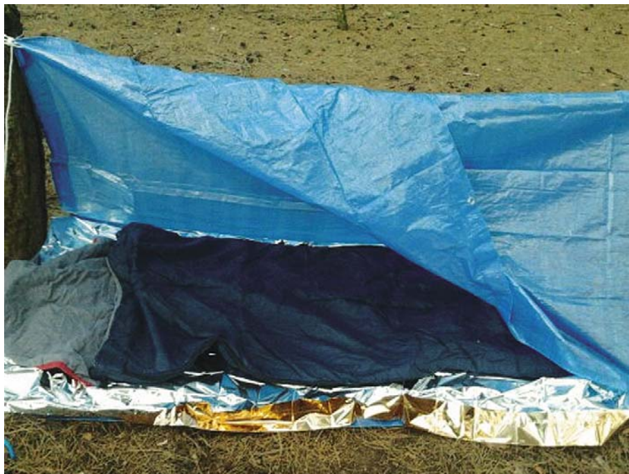
Fot. 3. Prowizoryczny nocleg w Roztoce Photo 3. A makeshift night in Roztocka