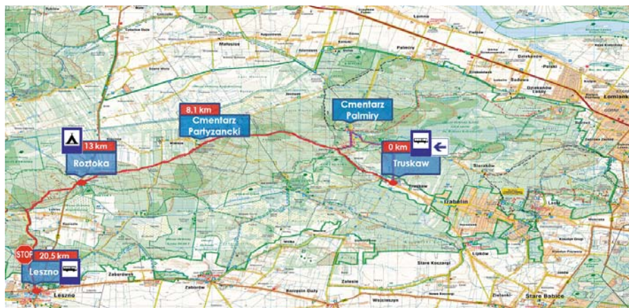
Fot. 5. Propozycja trasy Truskaw – Roztoka – Leszno

Natomiast druga, nieznacznie krótsza propozycja (Fot.5.) rozpoczyna się w Truskawiu, a dokładnie na polanie/parkingu samochodowym. Całościowa długość trasy wynosi 20,5 kilometra. Do Truskawia można dojechać samochodem lub autobusem komunikacji miejskiej. Polana turystyczna wyposażona jest wiaty i ławy. Okresowo w pobliżu polany działa mała gastronomia. Proponowana trasa wiedzie szlakiem czarnym w kierunku Cmentarza Palmiry lub alternatywnie szlakiem niebieskim obok polany w Pociemze do Palmir. Za polaną wzdłuż czarnego szlaku znajdują się kładki ułatwiające przejście nad okresowymi rozlewiskami, które stanowią mogą dodatkową atrakcją dla żądnych wrażeń uczestników zajęć survivalowych. Dalej trasa z Palmir prowadzi podobnie jak w pierwszej propozycji (Fot.1). Nocleg jest zaplanowany na polanie w Roztoce, a zakończenie w Lesznie, skąd jest możliwy powrót komunikacją miejską do Warszawy.