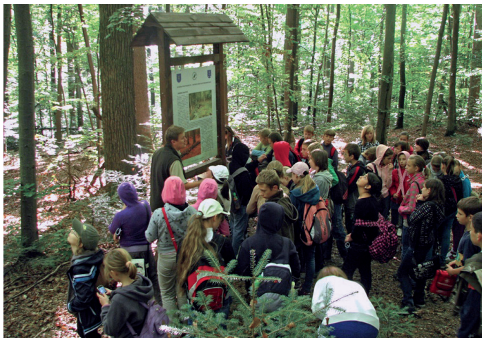
Fot. 2. Zajęcia na ścieżce im. Wybranieckich Fig. 2. Classes on the Wybranieccy path

Zajęcia mają charakter leśnej wycieczki, podczas której przewodnik (pracownik nadleśnictwa) omawia poszczególne zagadnienia, również spoza tematyki tablic i przystanków, stosownie do wieku uczestników i oczekiwań nauczycieli (fot. 3). Zajęcia trwają zwykle od 2-3 godzin, w części przyrodniczej, do 4-5 godzin w części historycznej.