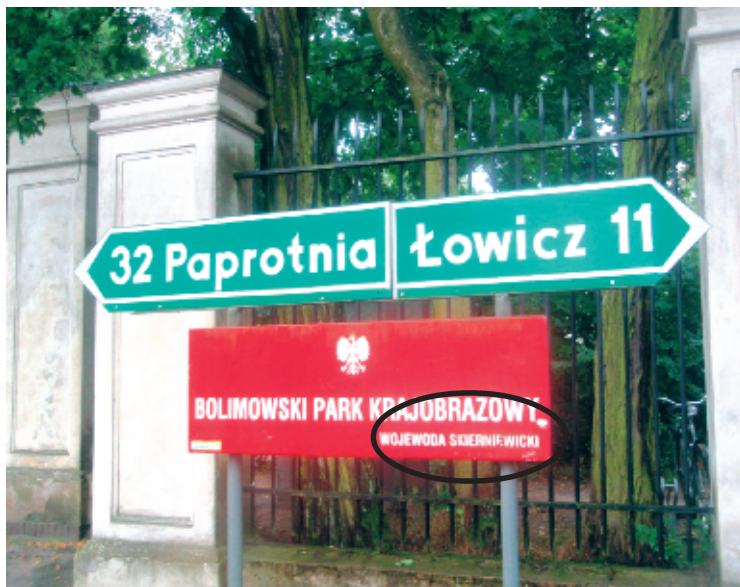
Ryc. 1. Tablica Bolimowskiego Parku Krajobrazowego przed pałacem w Nieborowie Fig. 1. Board of Bolimowski Landscape park in front of the palace in Nieborów

umieszczone są tablice zawierające mapę parku, jego opis oraz informacje dotyczące bazy noclegowej. Jest ich jednak za mało, brakuje takich tablic zwłaszcza przy najcenniejszych obiektach kulturowych: w Nieborowie oraz Arkadii. Ponadto na terenie parku znajduje się kilkadziesiąt tablic edukacyjnych, pozostających w gestii parku oraz nadleśnictw.