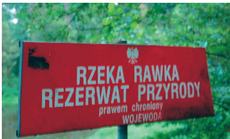
Ryc. 2. Tablica Rezerwatu Rawka Fig. 2. Board of Reserve Rawka