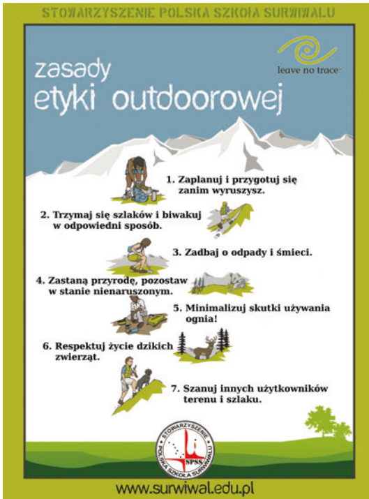
Ryc. 2. Karta referencyjna z zasadami Leave No Trace