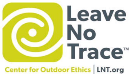
Ryc. 1. Oficjalne logo Leave No Trace Center for Outdoor Ethics

Aktualnie projekt LNT (ryc. 1) jest prowadzony i koordynowany przez organizację non-profit Leave No Trace Center for Outdoor Ethics (LNTOE), w stałym partnerstwie z pozostałymi partycypantami. Misją LNTOE jest nauczenie ludzi odpowiedzialnego korzystania z przyrody, poprzez edukację, badania, wolontariat i partnerstwo. Zasięg programu już dawno wykraczał poza granice Stanów Zjednoczonych, zyskując na całym świecie uznanie oraz liczne grono współpracowników. Na terenie Polski oficjalnym partnerem (Active Partner) LNTOE jest Stowarzyszenie Polska Szkoła Surwiwału.