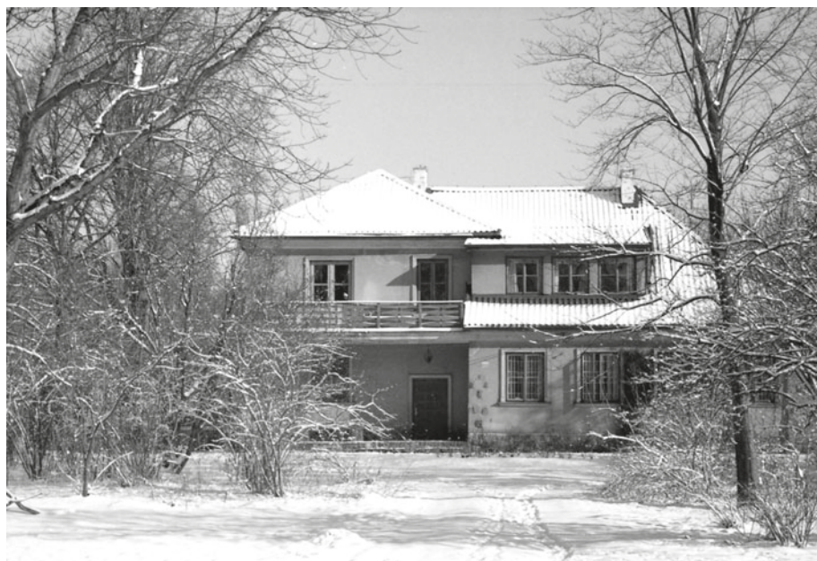
Fot. 6. Dom profesorski „Belwederek” (1995) Photo 6. Professors' house "Belwederek" (1995)

Postanowiono, że bursa będzie użytkowana do wakacji 1996 r., po czym rozpoczną się remonty. Niestety, prace projektowe, mimo ponagieł trwały bardzo długo. Pierwszą i jeszcze niekompletną dokumentację dotyczącą dwóch kotłowni oraz oczyszczalni ścieków otrzymaliśmy dopiero 2 lipca 1996 r., zaś ostatnie elementy projektów – 10 lutego 1997 r. W tym momencie podjęto ważną dla statusu ośrodka decyzję o włączeniu CEPL „na czas rozbudowy” do Leśnego Zakładu Doświadczalnego (Uchwała Senatu SGGW z 24 lutego 1997 r.).