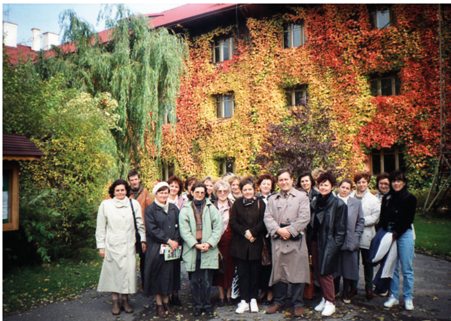
Fot. 12. Wojewódzka Konferencja Metodyczna, Rogów, 30 września 1996 r. Photo 12. Teachers Conference on Methodology (September 30, 1996)