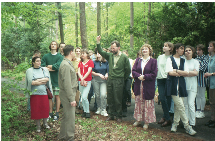
Fot. 11. Pierwsza lekcja w lesie w ramach działalności edukacyjnej CEPL (14 maja 1996 r.).

Ośrodków Metodycznych z Łodzi, Piotrkowa Trybunalskiego i Skierniewic oraz WFOŚiGW z Łodzi i Skierniewic, a także różnych jednostek LZD w Rogowie. Z perspektywy następnych lat należy podkreślić, że spotkały się wówczas osoby, które później odegrały bardzo pozytywną rolę w różnych fazach rozwoju naszego ośrodka.