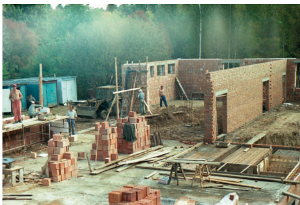
Fot. 9. Budowa auli budynku dydaktycznego CEPL (lato 1999): a – pracownie naukowe i fragment auli, b – fundamenty auli Photo 9. The main Center's building under construction (summer 1999): a – scientific laboratories and a part of the auditorium, b – the foundations of the auditorium