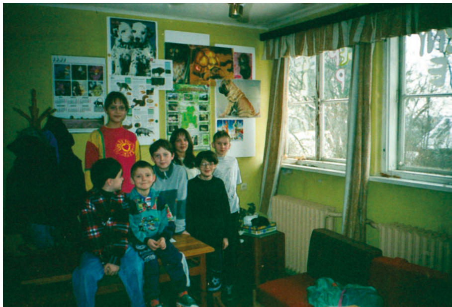
Fot. 14. W Klubie Ekologicznym „Cepelek” Photo 14. In “Cepelek” ecological club