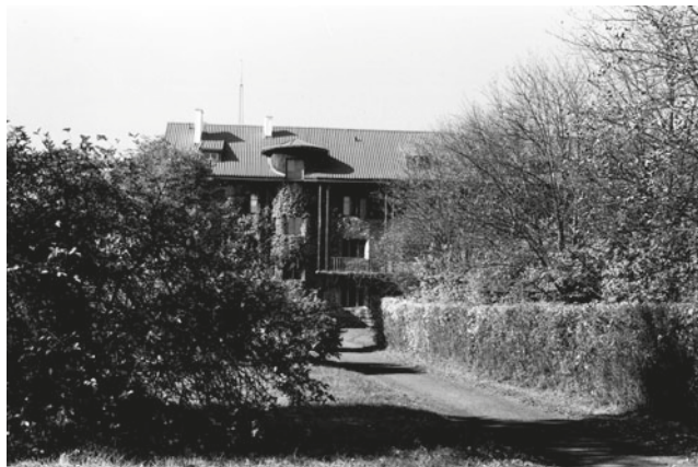
Fot. 4. Bursa studencka (1995) Photo 4. Student's dormitory (1995)

z Rogowa. Niestety, nie pozwoliło na to prawo budowlane, gdyż budynek obligatoryjnie musiał być ocieplony, a na warstwie izolacyjnej nie można było już mocować ciężkich pędów winobluszcza. W 1995 r. przyjęto dwa ważne akty: Senat SGGW podjął uchwałę „w sprawie powołania pozawydziałowej jednostki organizacyjnej o nazwie: Centrum Edukacji Przyrodniczo-Leśnej” (23 października 1995 r.), a następnie (3 listopada) JM Rektor SGGW wydał zarządzenie nr 17/95 w sprawie powołania CEPL. W dokumencie określono, że na potrzeby CEPL przeznaczają się bursę (fot. 4), budynek Muzeum Lasu i Drewna (fot. 5) oraz dom profesorski „Belwederek” (fot. 6). Kilka miesięcy później (6 maja 1996 r.) odbyło się pierwsze spotkanie Rady Programowej CEPL, na którym m.in. na stanowisko dyrektora CEPL powołano Krzysztofa Będkowskiego.