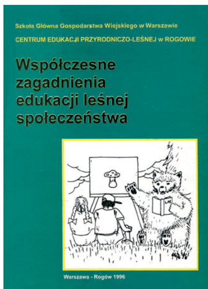
Fot. 13. Okładka wydanych drukiem materiałów pierwszej Konferencji Naukowo-Dydaktycznej „Współczesne zagadnienia edukacji leśnej społeczeństwa” (1996) Photo 13. A coversheet of printed proceedings of the first Scientific and Didactics Conference “Current problems in educating society in forestry” (1996)