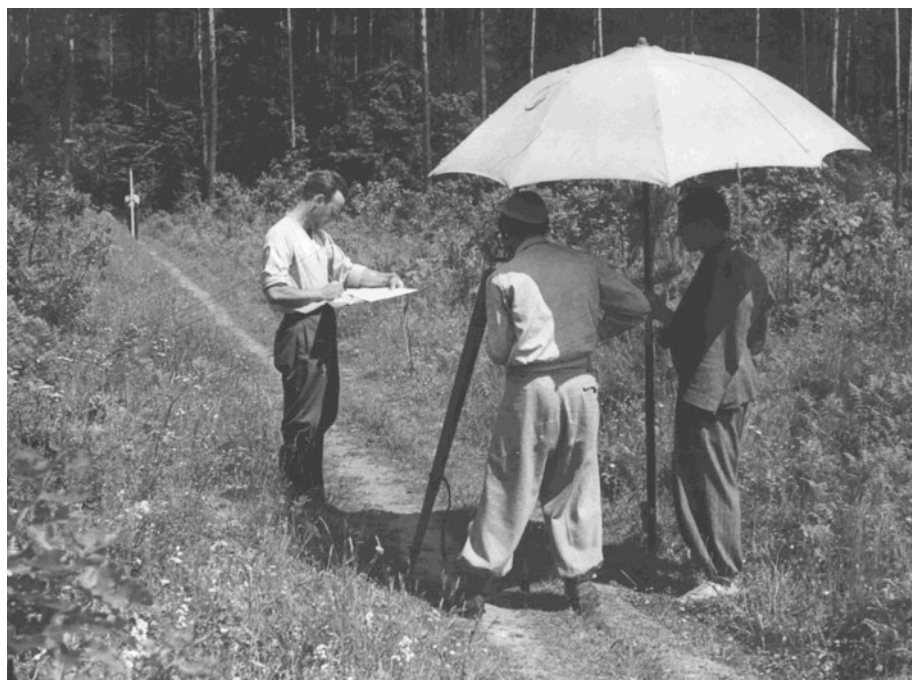
Fot. 1. Ćwiczenia z geodezji leśnej

Photo 1. Field survey exercises