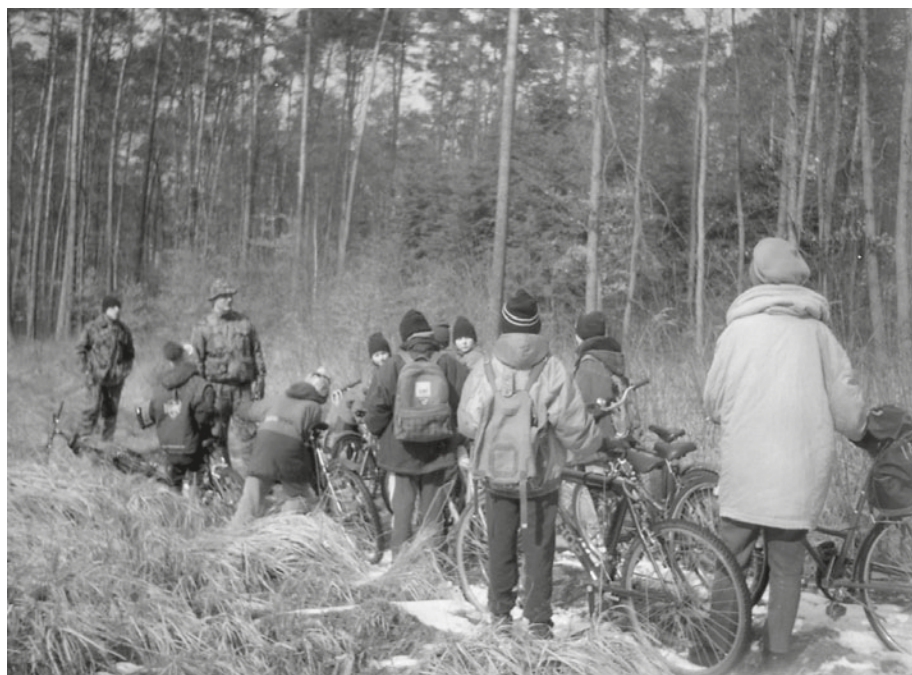
Fot. 15. Wycieczka Klubu Ekologicznego „Cepelek” Photo 15. An excursion organized by “Cepelek” ecological club