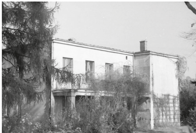
Fot. 5. Muzeum Lasu i Drewna (1995) Photo 5. Forest and Wood Museum (1995)