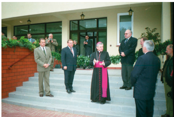
Fot. 10. Uroczystość oddania w użytkowanie budynku dydaktycznego i nowych ekspozycji w Muzeum Lasu i Drewna (19 września 2000 r.) Photo 10. Opening ceremony of the classroom building and the new exhibitions at The Forest and Wood Museum (September 19, 2000)