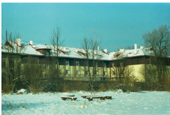
Fot. 7. Dawna bursa, obecnie Dom Studencki „Jodelka”: a – uroczystość oddania w użytkowanie (23 listopada 1998), b – budynek w szacie zimowej

Photo 7. Student's dormitory "Jodelka": a – opening ceremony (23. November 1998), b – building under snow cover