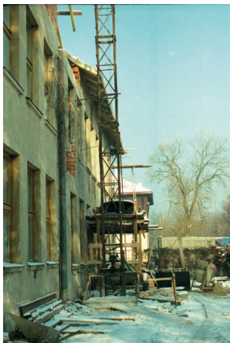
Fot. 8. Remont budynku Muzeum Lasu i Drewna (zima 1998/99): a – część z izbą edukacyjną w parterze, b – widok od strony dobudowanych później pracowni naukowych oraz auli Photo 8. Modernization of Forest and Wood Museum's building (winter 1998/99): a – activity room, b – building seen from the side of scientific laboratories and aula newly build up

Opracowane i przyjęte koncepcje funkcjonowania ośrodka zakładały potrzebę wyposażenia go w odpowiedniej wielkości aulę, w której mogłyby odbywać się wykłady dla studentów oraz szkolenia i konferencje naukowe. Od początku zakładano, że oprócz auli powstaną także pomieszczenia dla pracowni naukowych i biura CEPL, połączone w jedną całość z istniejącym budynkiem Muzeum. W sierpniu 1999 r. rozpoczęto prace budowlane (fot. 9), a już 19 września 2000 r. odbyły się uroczystości oddania w użytkowanie tej części budynku, pracowni naukowych oraz ukończonych ekspozycji w Muzeum Lasu i Drewna (fot. 10). Wyremontowano także dom profesorski „Belwederek”, który został następnie włączony do DS „Jodełka”.