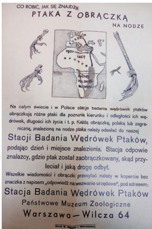
Fot. 1. Plakat Stacji Badania Wędrówek Ptaków (1938) Photo 1. Poster of Bird Migration Research Station (1938)

obráczki typu B, a najmniejsze – G. Na większych widniał napis: MUS. ZOOL. POLON. POLONIA, VARSOVIA, a na mniejszych: POLONIA VARSOVIA. Oprócz tego każda obrączka posiadała numer porządkowy (Archiwum MiIZ PAN a).