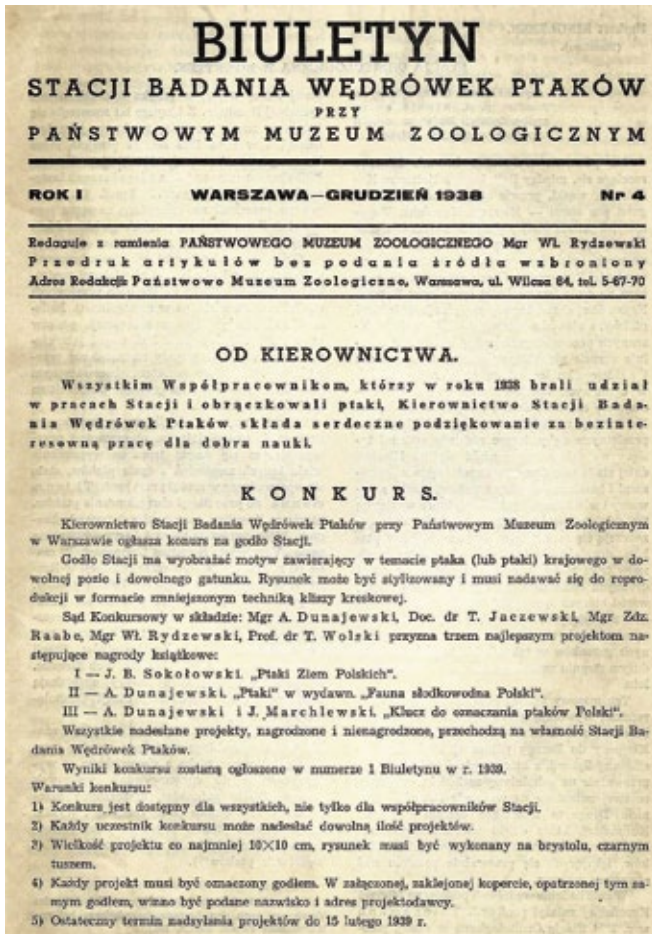
Fot. 4. Strona tytułowa Biuletynu Stacji Badania Wędrówek Ptaków, 4 (1938) Photo 4. Front page of Biuletyn Stacji Badania Wędrówek Ptaków, 4 (1938)

Pierwszy zeszyt, na którym widniał numer 1-2, ukazał się w kwietniu 1938 r. W ciągu roku planowano wydawać cztery zeszyty. Wybuch II wojny światowej uniemożliwił to zamierzenie. W sumie w 1938 r. ukazały się trzy numery, a w 1939 dwa (ostatni w czerwcu 1939, numer wrześnieowy uległ zniszczeniu w drukarni w czasie działań wojennych). Każdy z nich składał się z kilkunastu stron. Wydawnictwo to miało charakter popularnonaukowy, było przeznaczone dla szerokiej rzeszy odbiorców. Adres redakcji był tożsamy z adresem Muzeum. Całkowity koszt wydawniczy pokrywała Stacja (Biuletyn 1938-1939; Archiwum MiZ PAN a; Rydzewski 1949). Wydawanie Biuletynu zostało wznowione przez sukcesorkę Stacji Badania Wędrówek Ptaków – Stację Ornitologiczną Instytutu Zoologicznego Polskiej Akademii Nauk dopiero w 1970 r. („Biuletyn Biura” 1970).