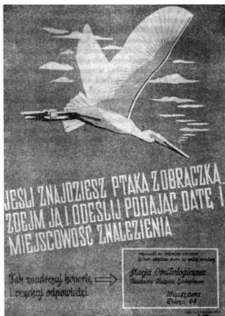
Fot. 3. Afisz Stacji Ornitologicznej z drugiej połowy lat 40. XX w. (Acta Ornithologica 1951) Photo 3. Poster of the Ornithological Station from the second half of the 1940s

1953 r. ukazało się zaledwie siedem artykułów, z czego cztery były sprawozdaniami z działalności Stacji Wędrówek Ptaków. Można uznać, że po wojnie pod względem naukowym, w porównaniu do okresu wcześniejszego, pismo to zamarło (Acta Ornithologica 1949-1953).