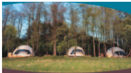
Fot. 1-2. Przedszkole leśne „Puszczek” w Białymstoku. Photo 1-2. Kindergarten „Puszczek” in Białystok.

Dzieci potrzebują orientacji, nastawiania na wartości, na wyrażenie i kształtowanie swoich potrzeb duchowych, moralnych. Poznawanie, tworzenie i odtwarzanie sztuki zaspokajają potrzeby estetyczne oraz kreatywne. Poznawanie kultury (kraju, regionu) zaspokajają potrzebę przynależności oraz przekazuje dziecku wartości historyczne. Wycieczki do ośrodków kultury i sztuki poszerzają zainteresowania oraz urozmaicają codzienny rytm zajęć wprowadzając jednocześnie dziecko w świat kultury i sztuki (Koc 2010, Preuss 2012, Pieprzyk 2014).