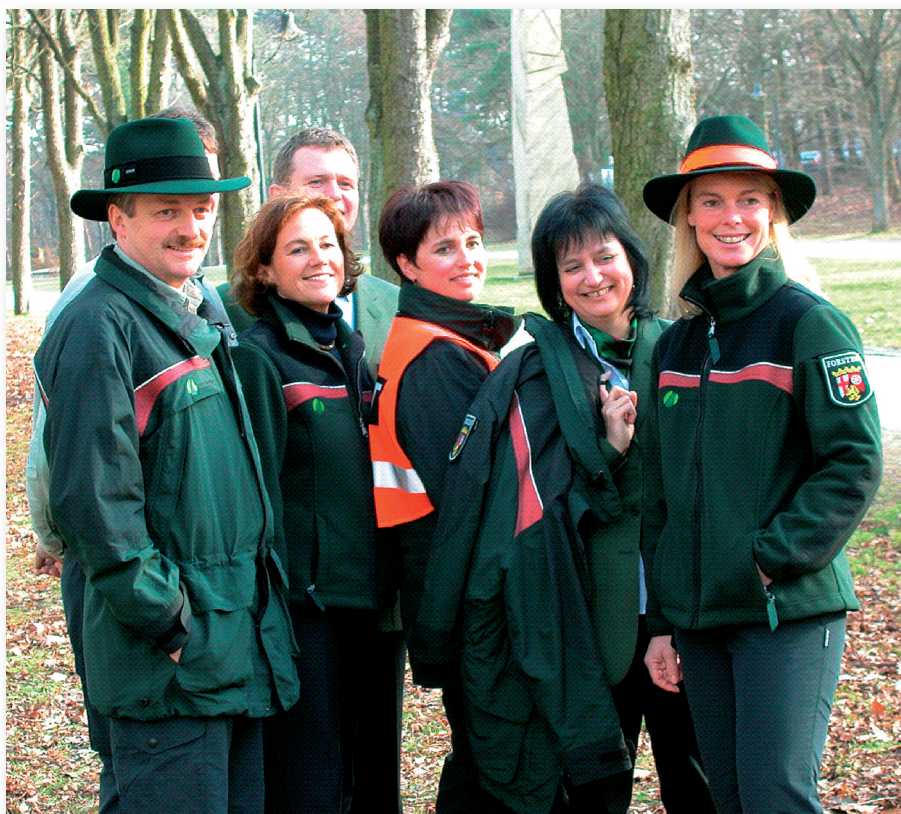
Fot. 4. Ubiorzy terenowe leśników z Nadrenii Palatynatu Photo. 4. Field uniforms of foresters from Rhineland-Palatinate

Na zakończenie jeszcze ciekawostka. Na potrzeby zespołu zadaniowego ORWLP w Bedoniu zapytał leśników lasów państwowych w innych krajach o noszone przez nich mundury. Okazało się, że w większości krajów Europy Zachodniej zrezygnowano z tego atrybutu służb leśnych (np. w Finlandii, Szwajcarii, Austrii, Irlandii). W nielicznych (Irlandia Północna, Szwecja) zdecydowano się na pozostawienie tylko nielicznych elementów odzieży wyróżniających leśników. Są to zwykle dodatki o nieformalnym charakterze: krawaty z logo firmy, bluzy polarowe, czapeczki, kurтки przeciwdeszczowe itp. Taki sposób postępowania tłumaczony jest zwykle względami oszczędnościowymi. W Niemczech leśnicy ubierają się w specjalnie zaprojektowane