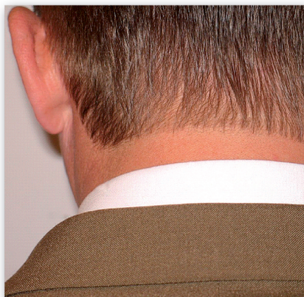
Fot. 1. Właściwie utrzymane włosy

Mówi się, że „nie szata zdobi człowieka” – nie należy ponoć oceniać ludzi po stroju, ale mówi się również „jak nas widzą, tak nas piszą”. A jak nas powinni widzieć w mundurze? Mundur powinien być zgodny ze wzorcem, kompletny – wtedy będziemy tworzyć wspólny wizerunek i będziemy rozpoznawalni, powinien być dopasowany do sylwetki kobiety lub mężczyzny, powinien być czysty, wyprasowany, bez obcych zapachów, a buty powinny być wyczyszczone. Pracownik w mundurze powinien mieć dobrze utrzymane włosy (fot. 1.), mężczyźni wygoloną twarz lub zadbane zarost, dobrze wywiązany krawat (fot. 2.), „zdrowy” oddech, zadbane dłonie.