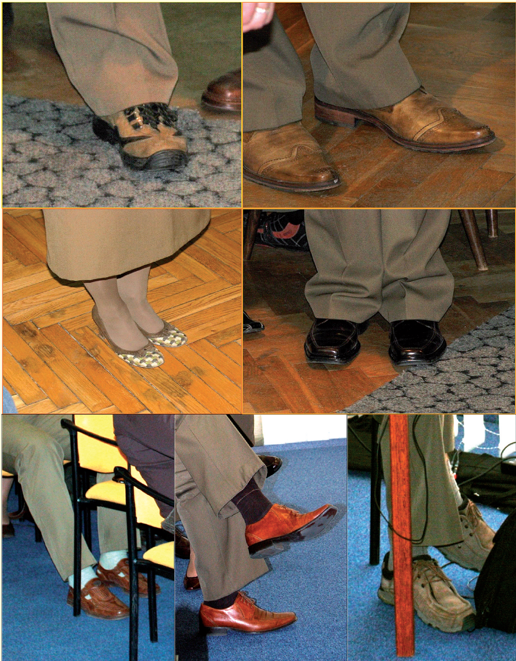
Fot. 3. Ach te buty, buty, buty ... Photo 3. Oh, shoes, those shoes...