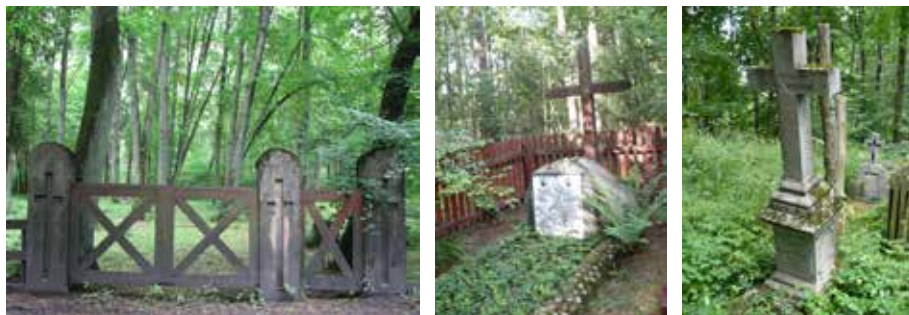
Fot. 1. A – Brama cmentarza w Rucianem Nidzie, B – pomnik – grób leśniczego Maskulińskiego i gajowego Uszko w Karwicy Mazurskiej, C – nagrobek na cmentarzu w Śwignajnie. 2011 rok

Wybrane cmentarze, najwyżej ocenione, po rewaloryzacji mogą stać się elementami tematycznego szlaku tanatoturystycznego, łączącego również inne obiekty turystyczne, znajdujące się w lasach lub tuż przy szlaku. Proponowany szlak wiódłby wzdłuż jezior Guzianka Wielka, Guzianka Mała, Wejsunek, Beldany, przez Mazurski Park Krajobrazowy, Kadzidłowo, Wojnowo, Ruciane Nida, obok Parku Dzikich Zwierząt Kadzidłowo. Objąłby również leśną ścieżkę dydaktyczną „Kadzidłowski Las”. Przy takiej trasie znajduje się 15 nieczynnych cmentarzy, w tym 5 z 9 uznanych w przeprowadzonej waloryzacji za najcenniejsze dla tanatoturystyki (są to cmentarze w miejscowościach: Ruciane Nida (fot. 1a), Nowa Ukta, Ukta, Karwica Mazurska, Śwignajno (fot. 1c).