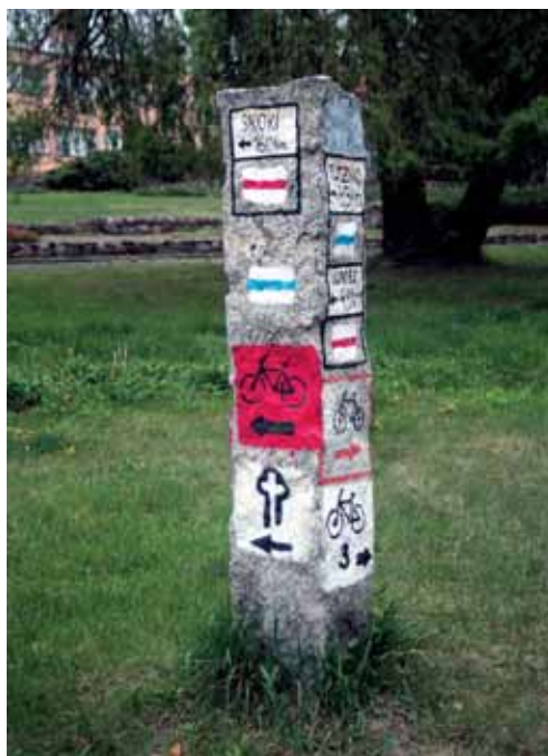
Fot. 2. Słupek drogowy szlaków turystycznych (fot. P. Anders) Photo 2. Signpost of tourist routes

Turystyka konna nie rozwinęła się tu zbyt. Przeważa nauka jazdy konnej w służących temu ośrodkach. Najbardziej znane działają w Owińskach i Sęszewku („Liljówka”). Wytoczono co