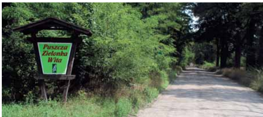
Fot. 1. Stary trakt śródleśny

Lata osiemdziesiąte nie przyniosły większych zmian w zagospodarowaniu Puszczy. Sytuacja radykalnie zmieniła się po 1989 roku. Odrodzony samorząd stał się rzeczywistym gospodarzem na swoim terenie. Innego wymiaru nabrały też kwestie zarządzania lasami i ochrony przyrody. Dość szybko powstało kilka parków krajobrazowych. Jednym z nich był Park Krajobrazowy „Puszcza Zielonka”, utworzony 20 września 1993 r. na powierzchni 9981,00 ha, z czego 80,7% to były tereny leśne, wchodzące w skład LZD Akademii Rolniczej w Poznaniu oraz nadleśnictw Czerwonak i Łopuchówko (Kasprzak 1996). W ten sposób zwyczajowa nazwa, rozpropagowana głównie w środowisku turystycznym, uzyskała urzędowe potwierdzenie. Za symbol parku przyjęto dąb i sosnę oraz rosnący pod nimi grzyb gąskę zielonkę.