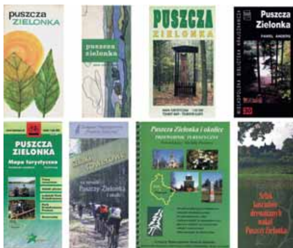
Ryc. 2. Okładki współczesnych wydawnictw dla turystów Fig. 2. Covers of contemporary tourist publications