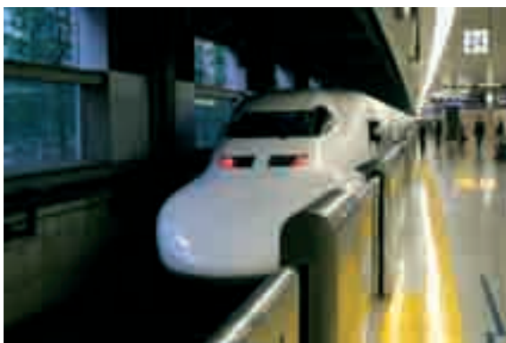
Fot. 5. Duma Japonii – superszybki ekspres Shinkansen Nozomi

Photo 4. Natural History Museum in Tokyo is an example of environmental education at the highest level