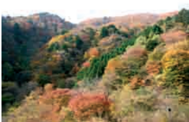
Photo 2. Natural mixed mountain forest in Chichibu National Park in the central part of Honshu island. Visible plantings of Japanese Cryptomeria japonica