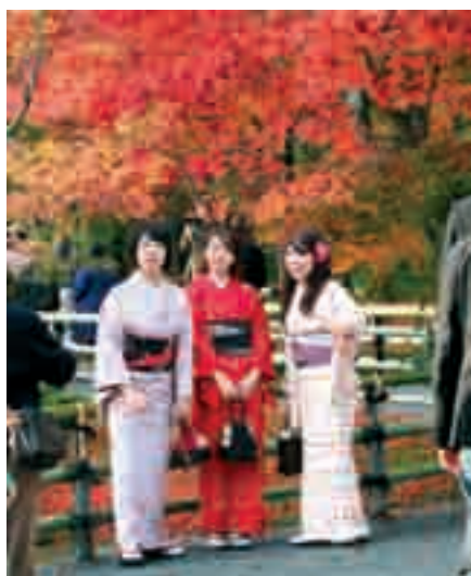
Fot. 6. Japonki ubrane w tradycyjne kimono to charakterystyczny obrazek z Kioto – dawnej stolicy Japonii pielęgnującej stare tradycje

Photo 5. Pride of Japan – Shinkansen Nozomi super speed express