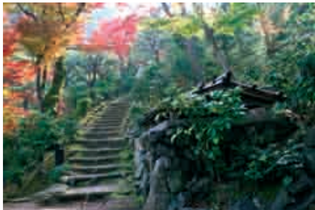
Fot. 7. Jeden z prywatnych ogrodów w Kioto o eklektycznym charakterze

Photo 7. One of the private gardens in Kyoto of an eclectic character