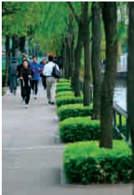
Fot. 10. Wyjątkowo czyste ulice i wypielęgnowana zieleni to wizytówka dużych miast, takich jak Tokio Photo 10. Exceptionally clean streets and groomed greenery is a showcase of cities such as Tokyo