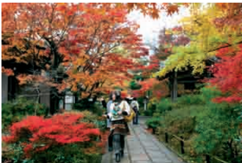
Fot. 11. Świątynia Jojako-ji w Kioto z mnóstwem przebarwiających się klonów palmowych i innych drzew i krzewów jest masowo oblegana każdej jesieni Photo 11. Temple Jojako-ji in Kyoto with a lot of discolourating Japanese maples and other trees and shrubs is extremely popular each autumn