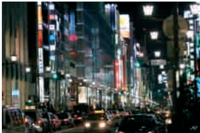
Fot. 1. Nowoczesność i tempo życia w Japonii widać szczególnie w centrach dużych miast. Na zdjęciu centralna dzielnica Tokio-Ginza

Photo 1. Modernity and the pace of life in Japan is particularly visible in the centers of large cities. In the photo the central district of Tokyo-Ginza