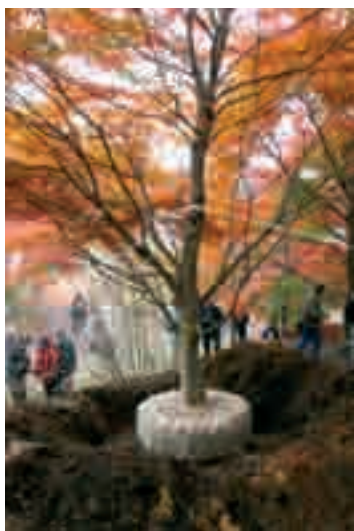
Fot. 14. Piękny okaz kłona palmowego gotowy do sprzedaży w jednej ze szkółek w prowincji Fukushima specjalizującej się w dużym materiale nasadzeniowym

Photo 14. Beautiful specimen of Japanese maple ready to sell in one of the nurseries in the province of Fukushima, specializing in large planting materials