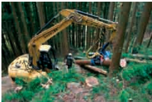
Fot. 3. Prace pielęgnacyjne w 80-letnim drzewostanie Cryptomeria japonica

Photo 3. The care work of in the 80-year-old Cryptomeria japonica stand