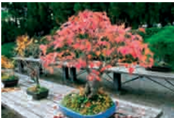
Photo 13. One of the national passion for the Japanese – bonsai. In the photo Japanese maple species Acer pycnanthum in the Kyoto Botanical Garden