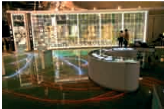
Fot. 4. Muzeum Historii Naturalnej w Tokio to przykład edukacji przyrodniczej na najwyższym światowym poziomie

Photo 4. Natural History Museum in Tokyo is an example of environmental education at the highest level