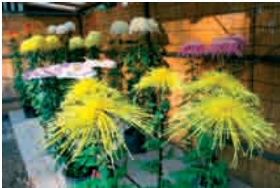
Fot. 12. Niezwykłe odmiany chryzantem można często spotkać wyeksponowane w różnych zabytkowych obiektach turystycznych

Photo 12. Unusual cultivars of chrysanthemums can often be found exhibited in various historical places of interest