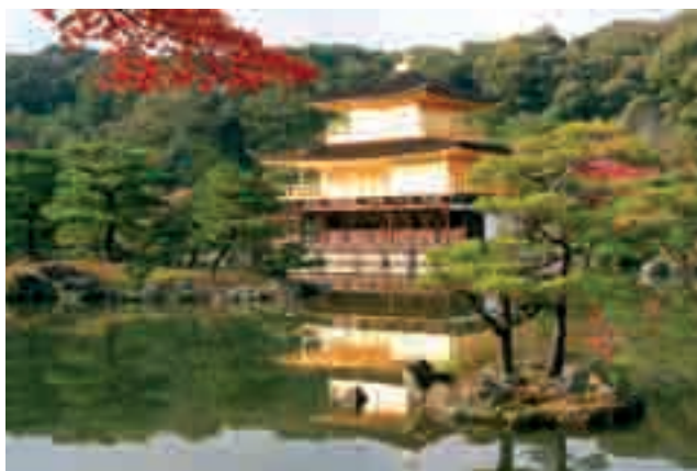
Photo 8. One of the most visited monuments in Japan – the Golden Pavilion in Kinkakuji Temple in Kyoto