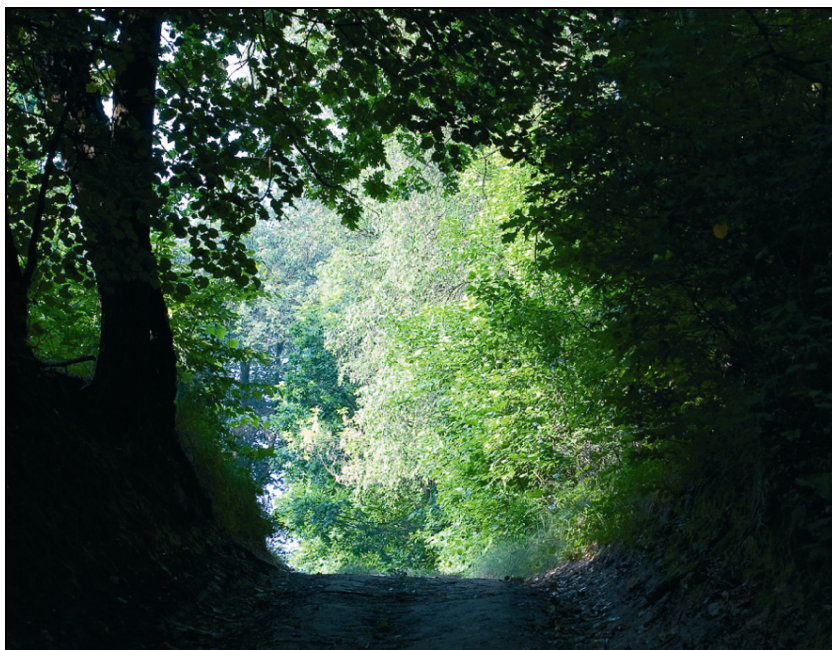
Fot. 2. Kontrast walorowy Photo 2. Value contrast

Tło stanowi podstawowy element odpowiedzialny za prawidłową ekspozycję. Pokazywane na nim elementy powinny odcinać się zgodnie z zasadami kontrastu walorowego, barwnego lub obydwu na raz. Wodząc okiem po pomieszczeniu, od razu zwracamy uwagę na ciemniejsze rzeczy. Stanowią one pewnego rodzaju punkty w przestrzeni.