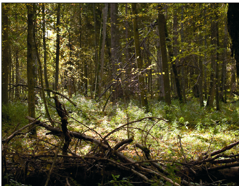
Fot. 3. Światło Photo 3. Light

W każdym pomieszczeniu powinno być oświetlenie ogólne. Można je zrealizować na wiele sposobów. Centralnie zamontowana lampa na suficie daje zdecydowanie najjaśniejsze światło. Innym sposobem może być umieszczenie kinkietów na ścianach lub rozmieszczenie lamp stojących. W przypadku tych drugich należy tak skierować promień światła, aby padał na sufit. Światło odbija się i rozprasza po całym pomieszczeniu.