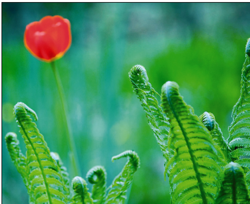
Fot. 1. Kontrast barw Photo 1. Colour contrast

Podczas łączenia barw należy stosować umiar w ilości użytych kolorów, łatwiej jest wtedy osiągnąć zamierzony cel i wyeksponować rzeczy istotne lub zgodne z naszymi zamiarami. Zbytne nagromadzenie środków plastycznych, w tym również kolorów, tworzy wrażenie chaosu i w istocie powoduje szum informacyjny oraz znaczeniowy.