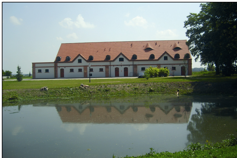
Fot. 2. „Obora”– obiekt edukacyjny Photo 2. “Cowshed”– educational building

Trzecim obiektem podworskim jest dawna „Obora”, wyremontowana w 2007 r.