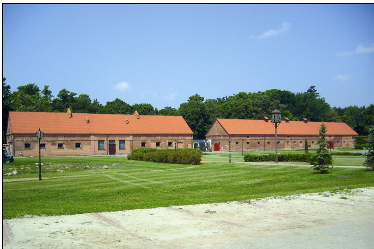
Fot. 1. „Powozownia” i „Owczarnia”– Muzeum leśnictwa Photo 1. “Carriage room” and “Sheepfold”– Forestry Museum

Zgodnie z konserwatorskimi zaleceniami zachowano tu pierwotny wygląd fasad budynków i niektóre elementy konstrukcji wewnętrznych. W murach zewnętrznych zostawiono dobrze zachowane fragmenty a zlasowane cegły wymieniono na nowe. Okna we wszystkich obiektach, choć współczesne stylem swoim naśladują oryginały z XIX w. Podobnie rzecz się ma z drzwiami zewnętrznymi w postaci wrót. We wszystkich obiektach założono nową dachówkę.