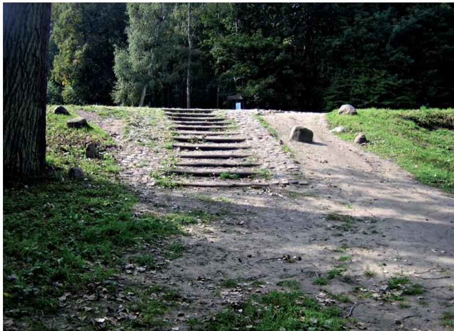
Fot. 3. Zejście do kapliczek w Lesie Łągiewnickim Photo 3. Descending entrance to the chapels in the Forest Łągiewniki

Podczas „inventaryzacji” oceniłam obiekty infrastruktury technicznej znajdujące się w najczęściej odwiedzanych przez społeczeństwo miejscach parku. Pod uwagę wzięłam także nierówności i przeszkody wynikające z samego ukształtowania terenu. Z ocenionych przeze mnie ok. 80 obiektów (ławek, punktów wypoczynkowo-turystycznych, mostków, zjazdów, podjazdów, tablic informacyjnych itp.) znaczna większość jest w bardzo dobrym stanie, przy czym nie oznacza to, że są one dostosowane do potrzeb osób niepełnosprawnych ruchowo (użytkowników wózków, kul). W przypadku miejsc odpoczynku, gdzie znajdują się ławki zestawione ze stołami, głównym problemem jest brak możliwości podjechania osoby na wózku inwalidzkim do stołu. Zjazdy i podjazdy m.in. do punktów widokowych (Plichtów), obiektów obserwacji i zwiedzania (kapliczki w Lesie Łągiewnickim) są z reguły niekorzystnie ukształtowane przez koła rowerów, niekiedy także samochodów. Spośród tablic informacyjnych – w bardzo dobrym stanie, ustawionych w odpowiednich miejscach i zagęszczeniu, żadna nie ma postaci pulpitu, z którego mogłyby swobodnie korzystać osoby na wózkach inwalidzkich.