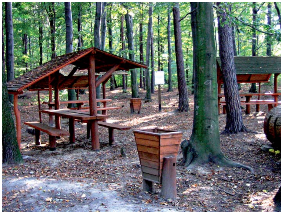
Fot. 2. Punkt wypoczynkowo-turystyczny w Janinowie

Fakt, że w chwili obecnej PKWŁ nie jest typowo dostosowany do potrzeb osób niepełnosprawnych, nie oznacza, że nie można na jego obszarze przeprowadzić zajęć z takimi osobami. Wymagałyby one jednak wprowadzenia kilku udogodnień podjętych z zwiększeniem bezpieczeństwa osób niepełnosprawnych, zwłaszcza tych poruszających się na wózkach inwalidzkich, a także dla wygody osób sprawnych.