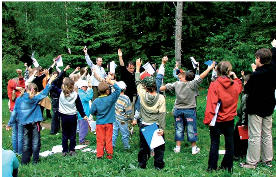
Fot. 3. „Dzieci Karkonoszy” 2005 – Zajęcia terenowe w Szklarskiej Porębie Photo 3. “Karkonosze Children” 2005 – outside classes in Szklarska Poręba