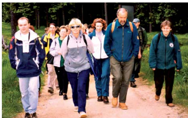
Fot. 2. Nauczyciele powiatu złotoryjskiego na warsztatach dydaktycznych w KRNAP Photo 2. Teachers from Złotoryja district during didactic workshops in KRNAP

W tej sytuacji park narodowy zobowiązany jest wpłynąć na podniesienie poziomu wiedzy i świadomości ekologicznej, a także postaw i systemu wartości społeczności lokalnej. Sprzyja temu niewątpliwie edukacja ekologiczna, której celem (zgodnie z agendą 21) jest m.in. tworzenie nowych wzorców zachowań jednostek, grup i społeczności, uwzględniający jakość środowiska.