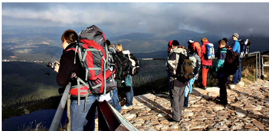
Fot. 6. Nad Kotłem Wielkiego Stawu, rajd naukowo-edukacyjny „Putiak” Photo 6. Over the Great Pond Cirque – “Putiak” scientific-educational rally