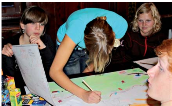
Fot. 7. Wieczorne warsztaty edukacyjne w schronisku „Strzecha Akademicka”, rajd naukowo-edukacyjny „Putiak”

Od lutego 2009 do końca listopada 2010 roku 60-osobowa grupa młodzieży wraz z nauczycielami i pracownikami parków będzie jeździć na tereny Karkonoskiego Parku Narodowego i Krkonosskeho narodniho parku celem realizacji programu w zakresie poznawania wartości karkonoskiej przyrody (tematyka zajęć: Ptaki, Drzewa, Geologia i geomorfologia, Drugie życie drzewa, Myślistwo z punktu widzenia parku narodowego), zasad zachowania bezpieczeństwa w górach (Zima w Karkonoszach), wpływu człowieka na przyrodę (Gospodarka odpadami), obserwacji przyrodniczych i integracji