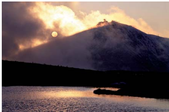
Fot. 1. Śnieżka Photo 1. Mount Śnieżka

rozwoju – karkonoscy przedsiębiorcy szansę rozwoju widzieli wyłącznie w rozbudowie sieci wyciągów narciarskich, przy czym tereny objęte ochroną ścisłą wydawały się im szczególnie atrakcyjne. I tu właśnie – na płaszczyźnie konfliktu park narodowy – społeczność lokalna szczególnie mocno odzwierciedliły się 2 sprawy: brak wiedzy mieszkańców i samorządowców o obszarze chronionym i brak emocjonalnego stosunku do tych terenów, które są przecież najwyższą formą ochrony przyrody w Polsce. Zrównoważony rozwój – z definicji – jest to całościowy kształt harmonijnych działań człowieka korzystającego z zasobów środowiska przyrodniczego w sposób racjonalny, odpowiedzialny i gwarantujący ich zachowanie dla przyszłych pokoleń.