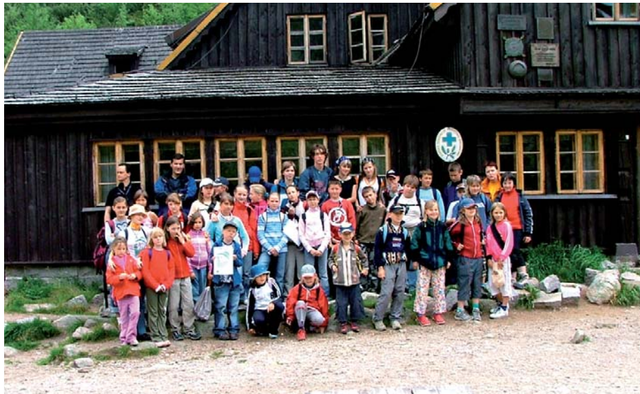
Fot. 4. „Dzieci Karkonoszy” 2006 – schronisko „Samotnia” Photo 4. “Karkonosze Children” 2006 – Samotnia shelter