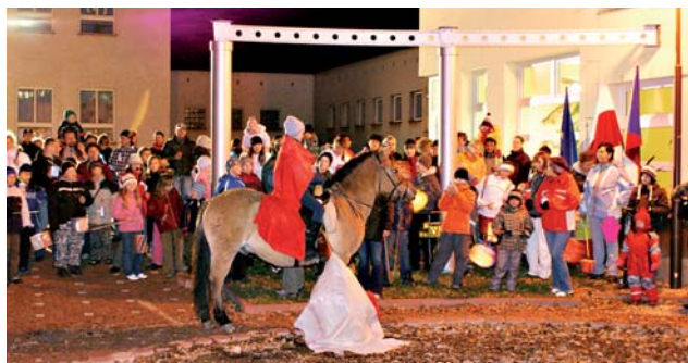
Fot. 5. „Dzieci Karkonoszy” 2009 – Lanov (Republika Czeska) – Dzień świętego Marcina Photo 5. “Karkonosze Children” 2009 – Lanov (Czech Republic) – St. Martin’s Day