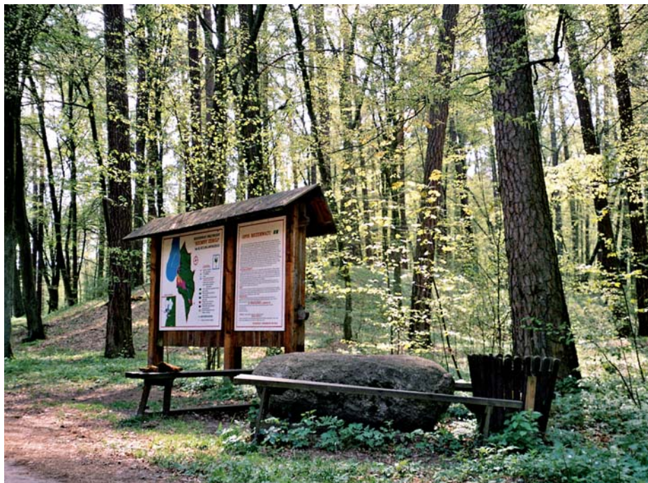
Fot. 3. Finansowanie projektów edukacyjnych jest szczególnie ważne w parkach narodowych i krajobrazowych, a także w Leśnych Kompleksach Promocyjnych tłumnie odwiedzanych przez turystów

Photo 3. The financing of education projects is particularly important in the national landscape parks, as well as in the Promotional Forest Complexes visited by crowds of tourists